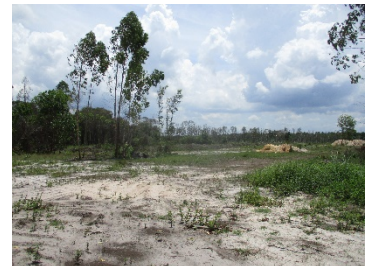
หน้าเหมืองปัจจุบัน