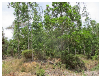
แนวเว้นไม้ทำเหมืองระยะ 10 เมตร