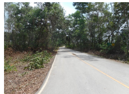
เส้นทางเข้าสู่พื้นที่โครงการ