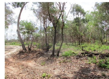
แนวเว้นไม้ทำเหมืองระยะ 50 เมตร